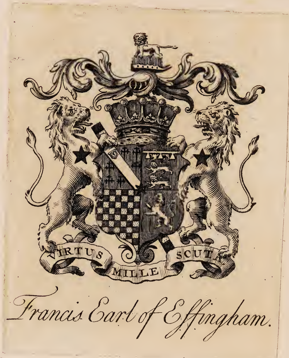
Francis Earl of Effingham.